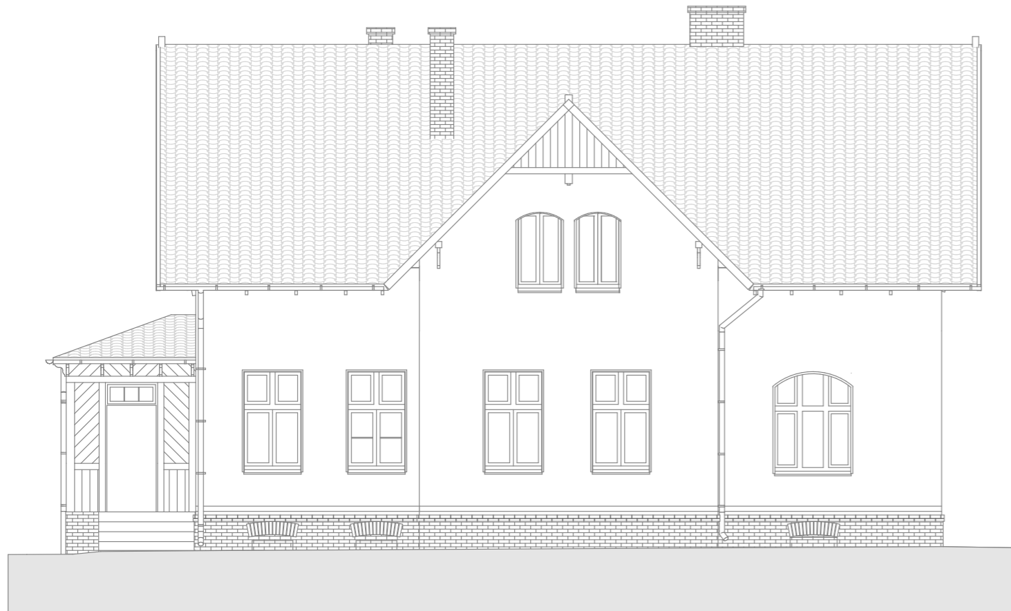
E1 ELEWACJA ZACHODNIA