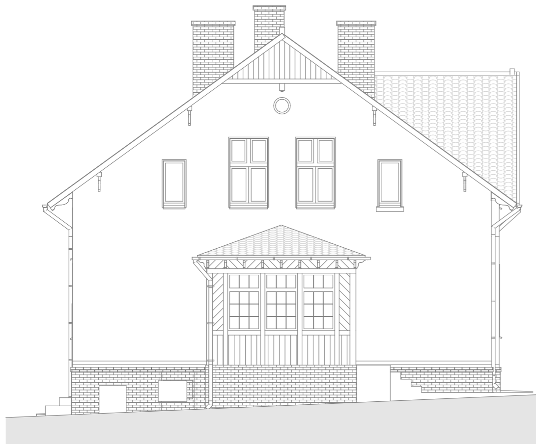
E2 ELEWACJA PÓLNOCNIA