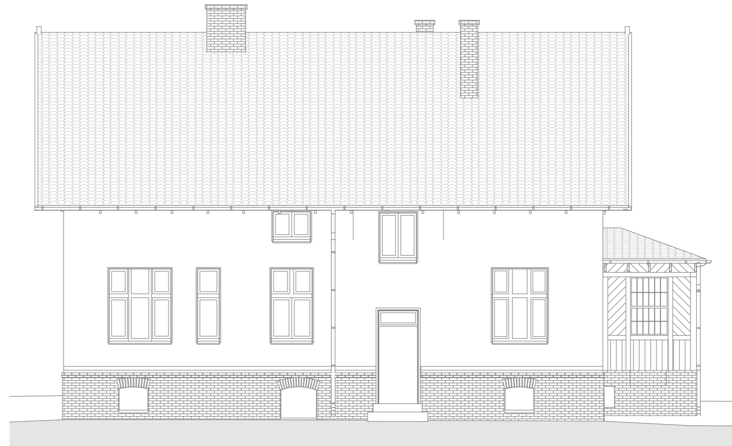
E3 ELEWACJA WSCHODNIA